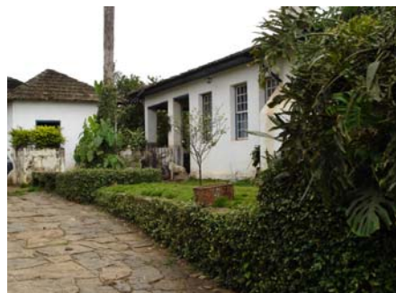
Fazenda da Pedra Branca – 2005