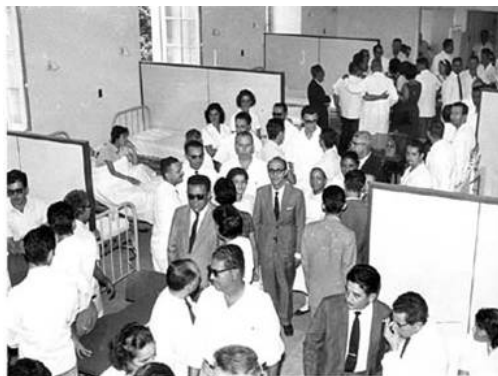
Inauguração da Enfermaria Sta. Anna

“Com base, sobretudo, em recente documento (nº 04) da Comissão de Ensino Médico do Ministério da Educação e Cultura, destacarei, entre os diversos fatores condicionantes da crise nacional dos hospitais de ensino, os três seguintes: a) ausência de uma definição política do MEC em relação aos hospitais de ensino; b) Ausência de planejamento adequado aliado a uma administração anacrônica altamente ineficaz; c) insuficiência de recursos financeiros”.