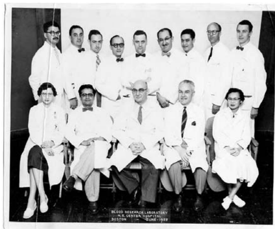
Boston –1955 Fundação

Além de estudioso constante e de professor atuante e renovador foi também um investigador incansável e fecundo. Disto dá prova sua bagagem de mais de uma centena de trabalhos e pesquisas, das quais a grande maioria foi publicada em periódicos