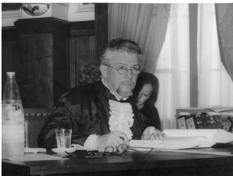
Durante concurso de Livre Docência, na sala da Congregação da Faculdade de Medicina da USP, em 1985.