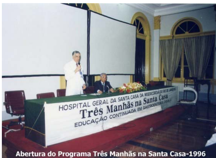
Abertura do Programa Três Manhãs na Santa Casa-1996