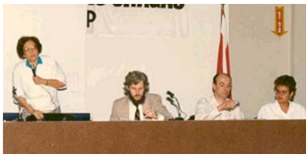
50 anos do Instituto Evandro Chagas. Belém. Pará.

Entre 1989 e 1994 coordenou estudos sobre a imunogenicidade, eficácia e efetividade da vacina contra a hepatite B junto ao município de Boca do Acre. A soroteca – exemplarmente analisada e acondicionada no IEC – e as informações advindas desses estudos, constituem sólida referência tanto para a memória, como para estudos subsequentes sobre a hepatite B na Amazônia.