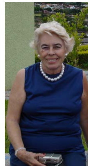
Norah Gusmão de Figueiredo Mendes

Atuou, também, como escritor de inúmeros livros médicos. A grande maioria sobre doenças do fígado. Foi o idealizador da primeira e ainda única revista brasileira de hepatologia, denominada “Moderna Hepatologia”, que mantém nome e formato original até hoje. Seus artigos permitem que médicos de diferentes regiões do Brasil se atualizem, através de artigos elaborados por hepatologistas brasileiros de renome.