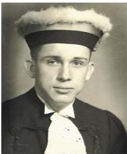
Graduado pela Faculdade de Medicina da Universidade de São Paulo em 1956

A graduação em Medicina ocorreu em dezembro de 1956, seguida de residência médica em Cirurgia, ainda no Hospital das Clínicas da FMUSP. Para iniciar sua vida profissional decidiu sair de São Paulo e foi para Florianópolis, onde um tio médico lhe deu acolhida e compartilhou as dificuldades iniciais de sua atividade médico-cirúrgica. Durante 17 anos, exerceu a profissão como cirurgião, sendo muito requisitado, devido sua extrema dedicação aos pacientes. Com seu espírito vivaz e irrequieto, entretanto, não se restringiu a examinar, operar e cuidar intensivamente de seus pacientes. Querendo ir além, passou a acompanhar o diagnóstico macro e