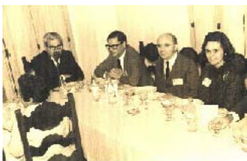
1. Congresso Brasileiro de Hepatologia DESENVOLVIMENTO DA SAÚDE - Outubro 17 a 20 de Novembro Paulista - São Paulo